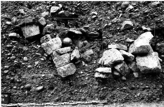
Abb. 7. Basel BS, Rittergasse 4. Querschnitt durch den Murus Gallicus (Ostschnitt 1991). Links die nach vorn gekippte Trockenmauer der Front, dahinter im Wallinnern eine Packung aus Kalkbruchsteinen, vermutlich zur Drainage. Unmittelbar hinter den obersten Steinen der Front wurde ein mittelalterliches Grab eingetieft (das Becken noch in situ ).

bis auf die unterste Lage abgetragen und anschliessend repariert worden. Die Reparatur erstreckt sich aber höchstens auf die vordersten zwei Meter des Walls, das Wallinnere ist nicht davon betroffen und besteht aus einer einzigen Phase, datierbar in die 2. Hälfte des 1. Jh. v. Chr.