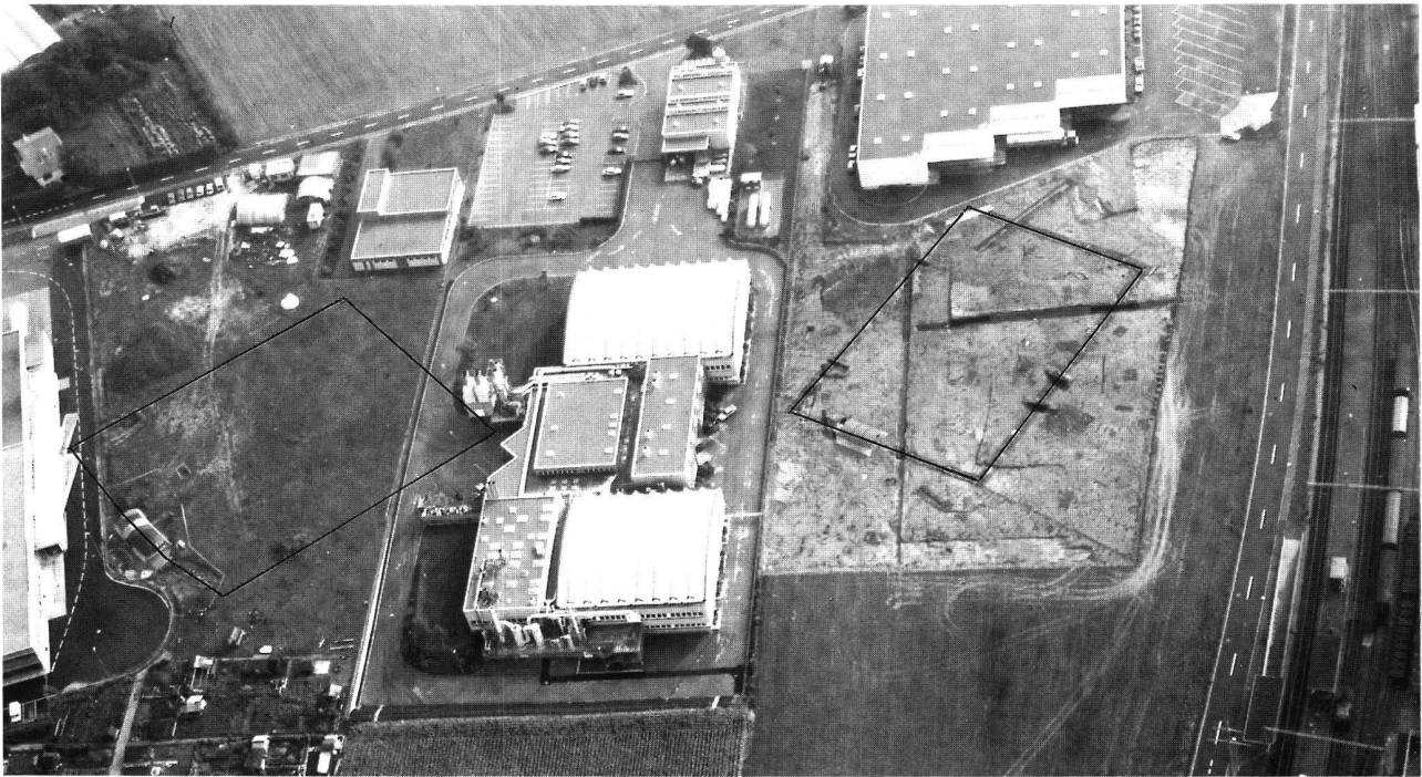
Fig. 8. Marin-Epagnier NE. Les deux enceintes laténiennes de Marin-Epagnier (septembre 1991). A gauche, celle des Bourguignonnes avec la partie centrale de son fossé nord-ouest en cours de fouille; à droite, celle de Chevalereux, totalement dégagée. Sur ce dernier site, toutes les anomalies observées lors du terrassement (donc aussi le fossé), ont été recouvertes par un plastique noir, empêchant le sol de sécher et la végétation de pousser jusqu'à la mise en chantier des fouilles. Une fois les machines de chantier parties, ces anomalies ont pu être observées à loisir et la moitié d'entre elles se sont révélées être des formations naturelles.