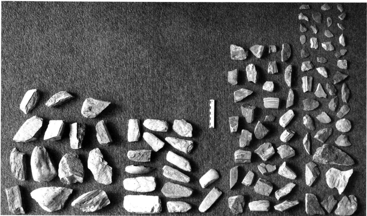
Abb. 1. Das Werkstattensemble vom Seegubel. Auf einer kleinen Fläche von 5 \times 10 m konnten auf dem Seegrund total 245 Funde geborgen werden. Bezeichnend ist, dass 24% der Steine aus Passstücken bestand, 46% Sägeschnittspuren aufwies und dass unbeschädigte Beilklingen an dieser Stelle fehlten. Die Foto zeigt 100 repräsentative Stücke, die im richtigen Verhältnis zueinander ausgewählt wurden und gemäss den fünf Fundkategorien angeordnet sind. Vergleiche auch die Abb. 2 und 3.