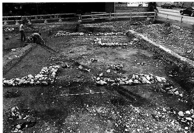
Abb. 2. Chur GR, Areal Brauerei. Im Vordergrund Eingangspartie des Gebäudes 2, von Süden.