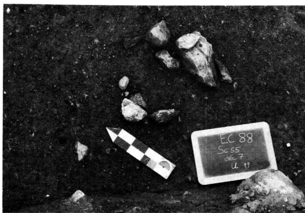
Fig. 1. Pierres de calage d'un trou de poteau.