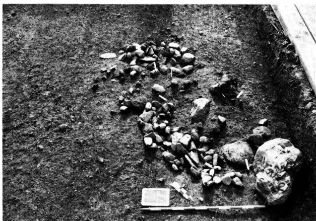
Fig. 3. Grand fossé.