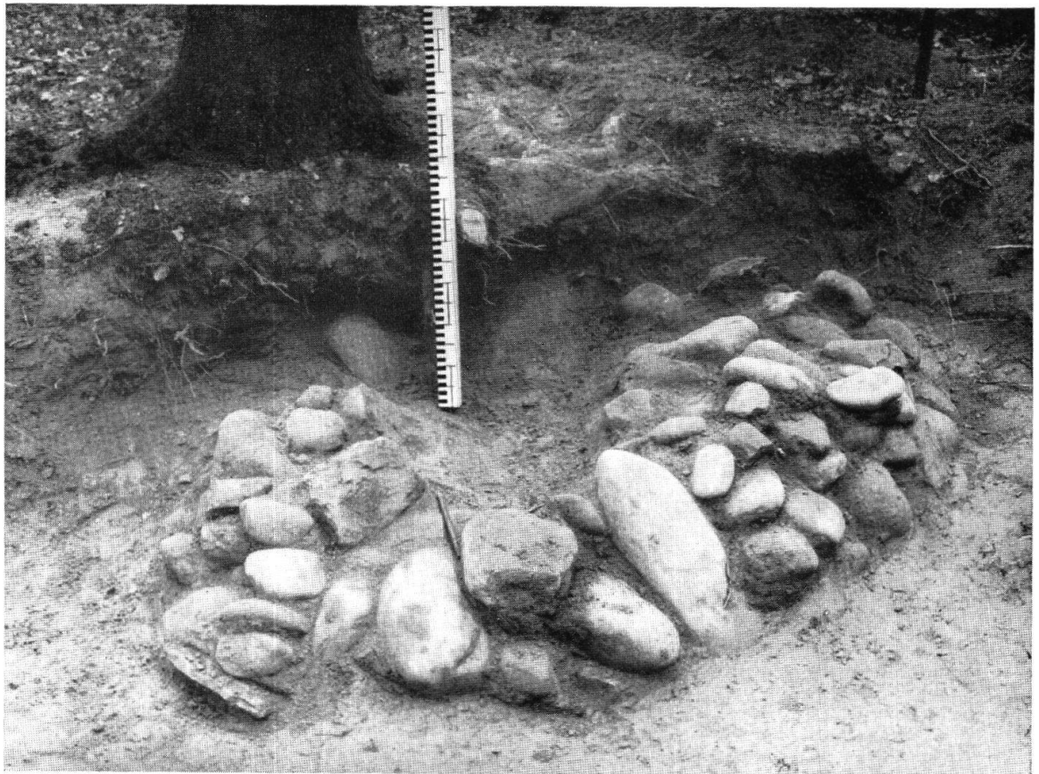
Taf. XII, Abb. 2. Lyß. Steinsetzung inmitten eines Grabhügels (S. 80) Aus JB. BHM 1951