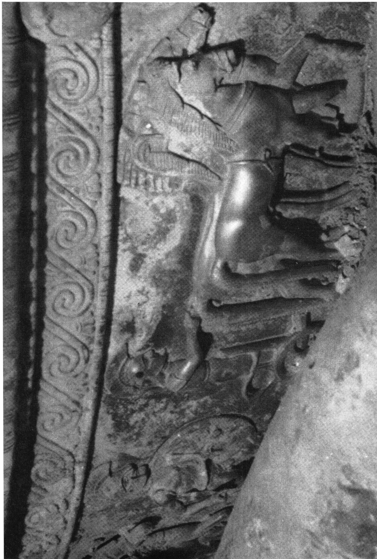
Pl. XI. Vix près de Châtillon-sur-Seine (Côte-d'Or), tumulus hallstattien. Détail du cratère grec (p. 74)