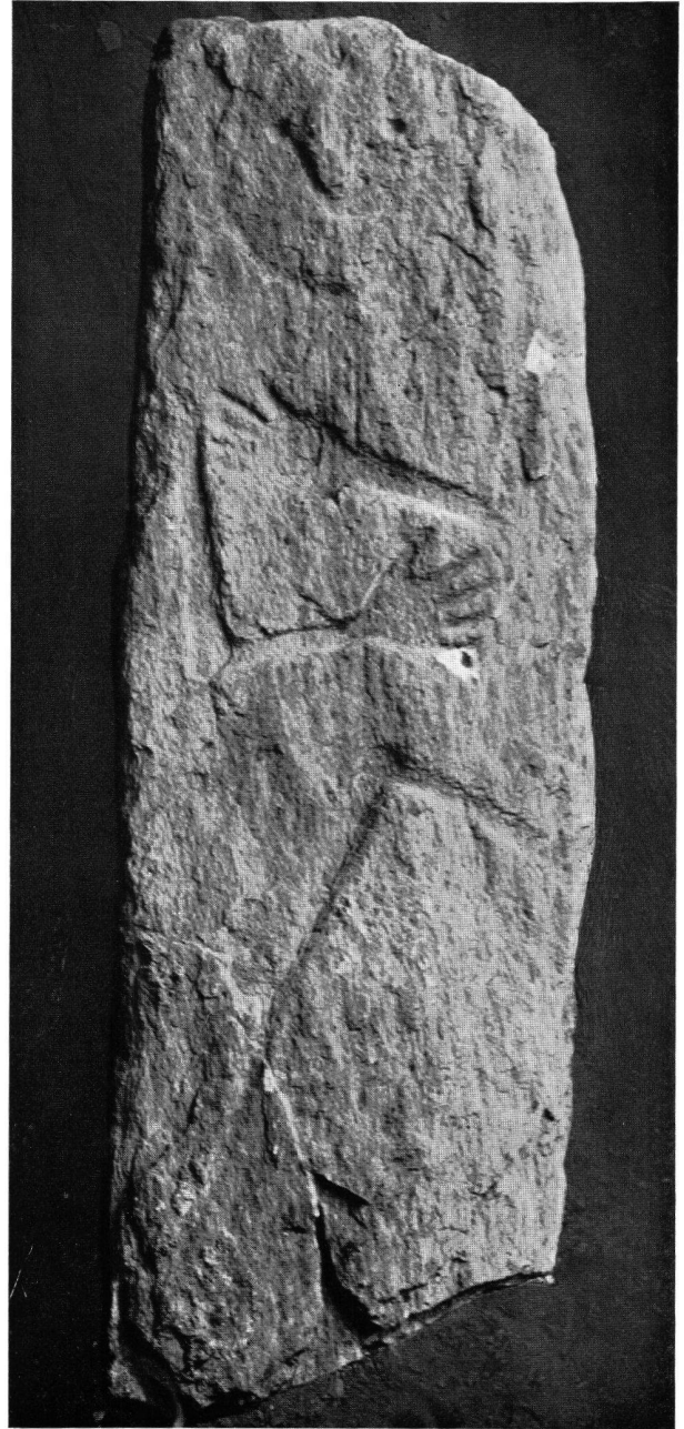
Tafel 6. – 1. Donath GR, Surses. 1. Frühbronzezeitliche Flügelnadeln (Länge 12,3 und 8,4 cm) und Ösenkopfnadel (Länge 17,2 cm) aus dem Erwachsenendoppelgrab (Taf. 5, 3 u. S. 66). – 2. Lumbrein GR, Sietschen. Quarzitplatte mit menschlicher Figur, Höhe 180 cm (S. 72). – 3. Sta. Maria i. C., GR. Vaso a trottola con decorazioni geometriche policrome (periodo La Tène). Altezza 11 cm (p. 73).