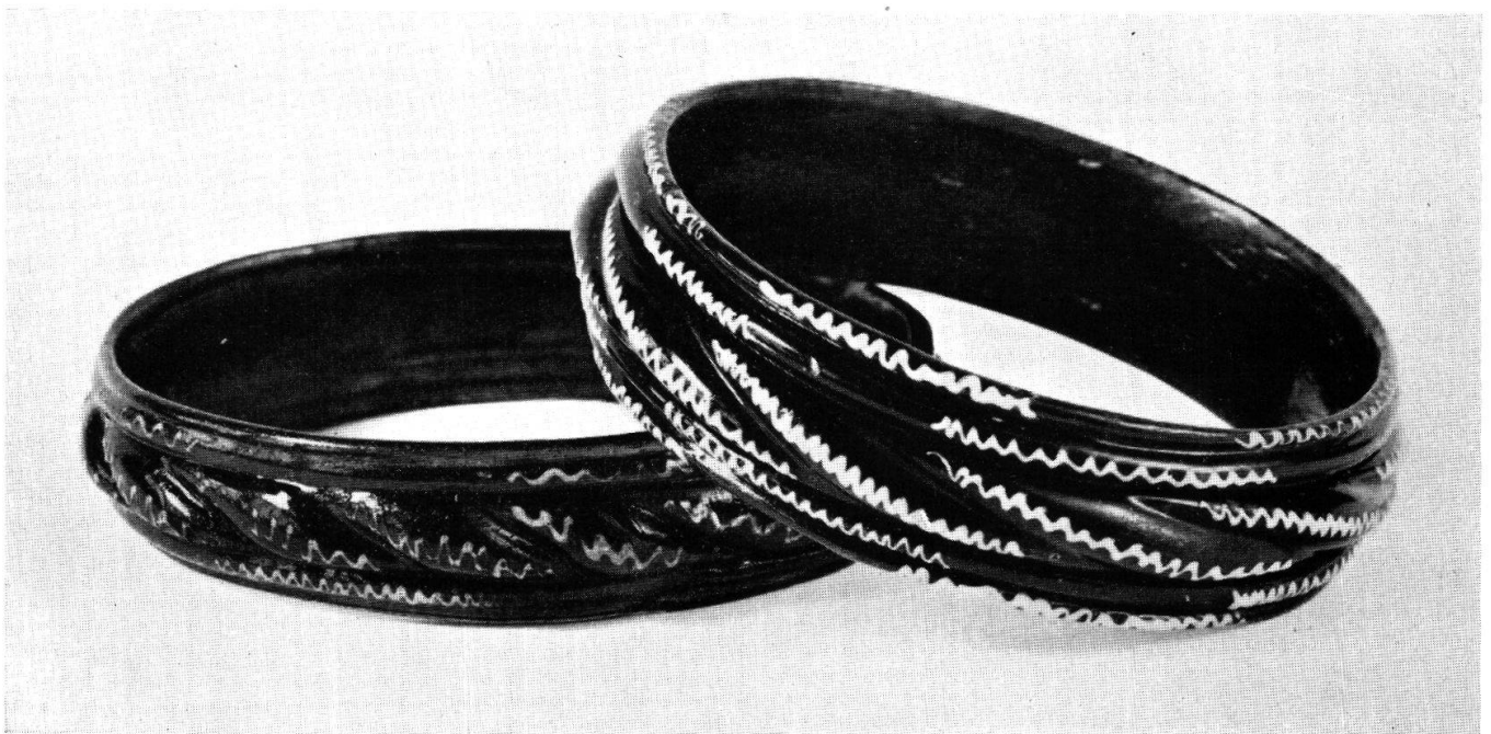
C Oberglatt ZH, Bahnhof. Grabfund 1956. M. 1:1. Aus JbSLM 1956. (S. 114)