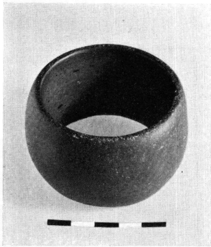
A Büren a. A. BE, Werk Aaregrien 1956. M. 1:2. Aus JbBHM 1955/56. (S. 108)