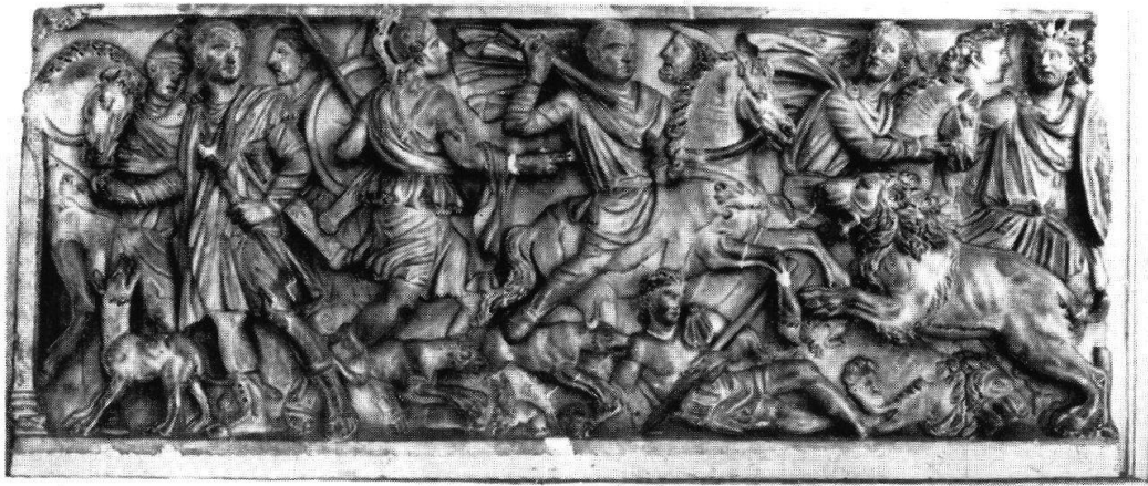
Abb.1 Sarkophag mit Löwenjagd