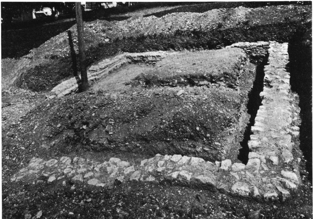
Tafel IX, Abb. 2. Osterfingen. Frühmittelalterliche Siedlung (S. 80)