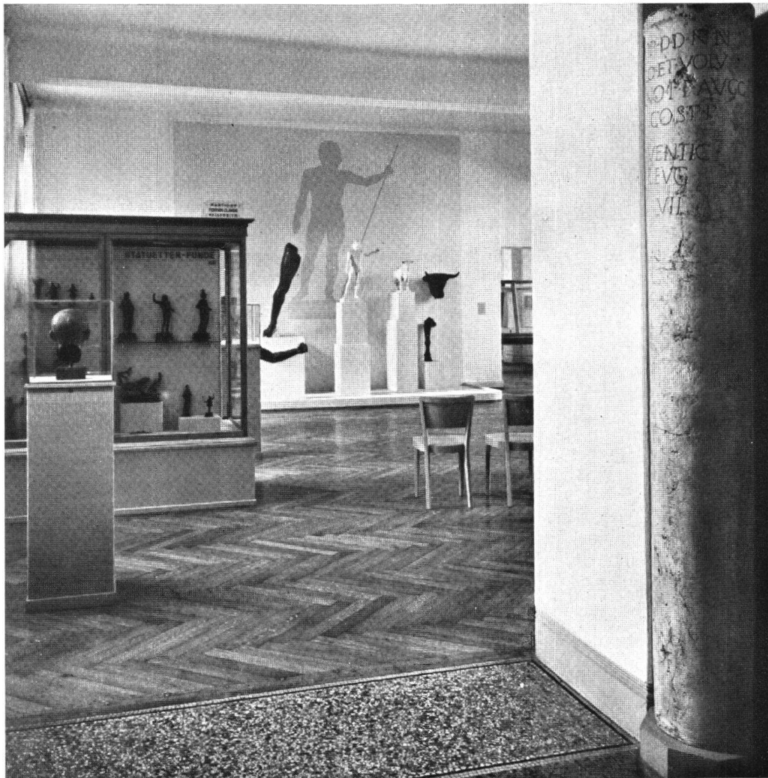
Tafel I, Abb. 1. Saal Nr. 73, römische Plastiken im Schweiz. Landesmuseum (S. 14) Aus JB. LM. 1947