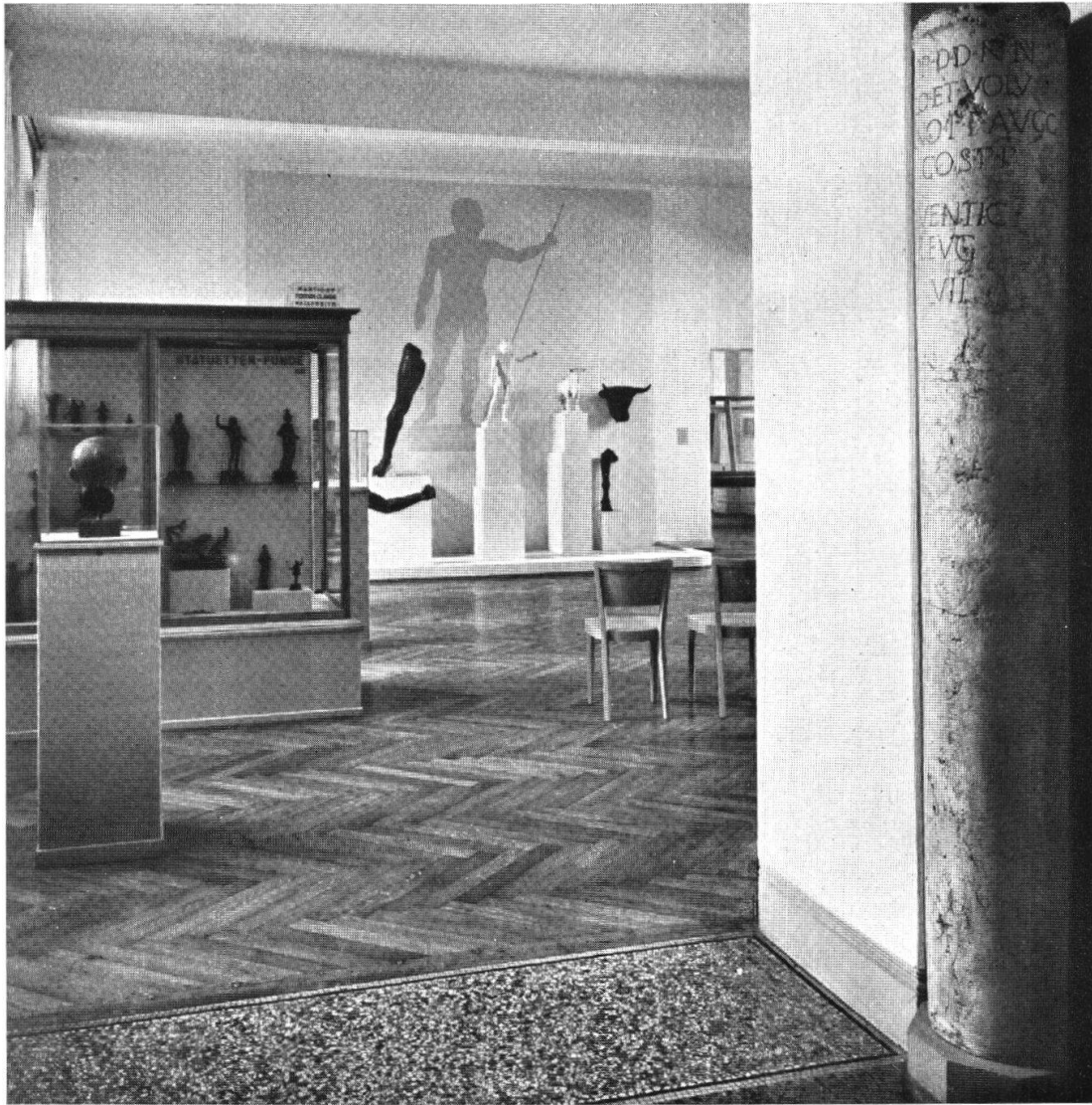
Tafel I, Abb. 1. Saal Nr. 73, römische Plastiken im Schweiz. Landesmuseum (S. 14) Aus JB. LM. 1947