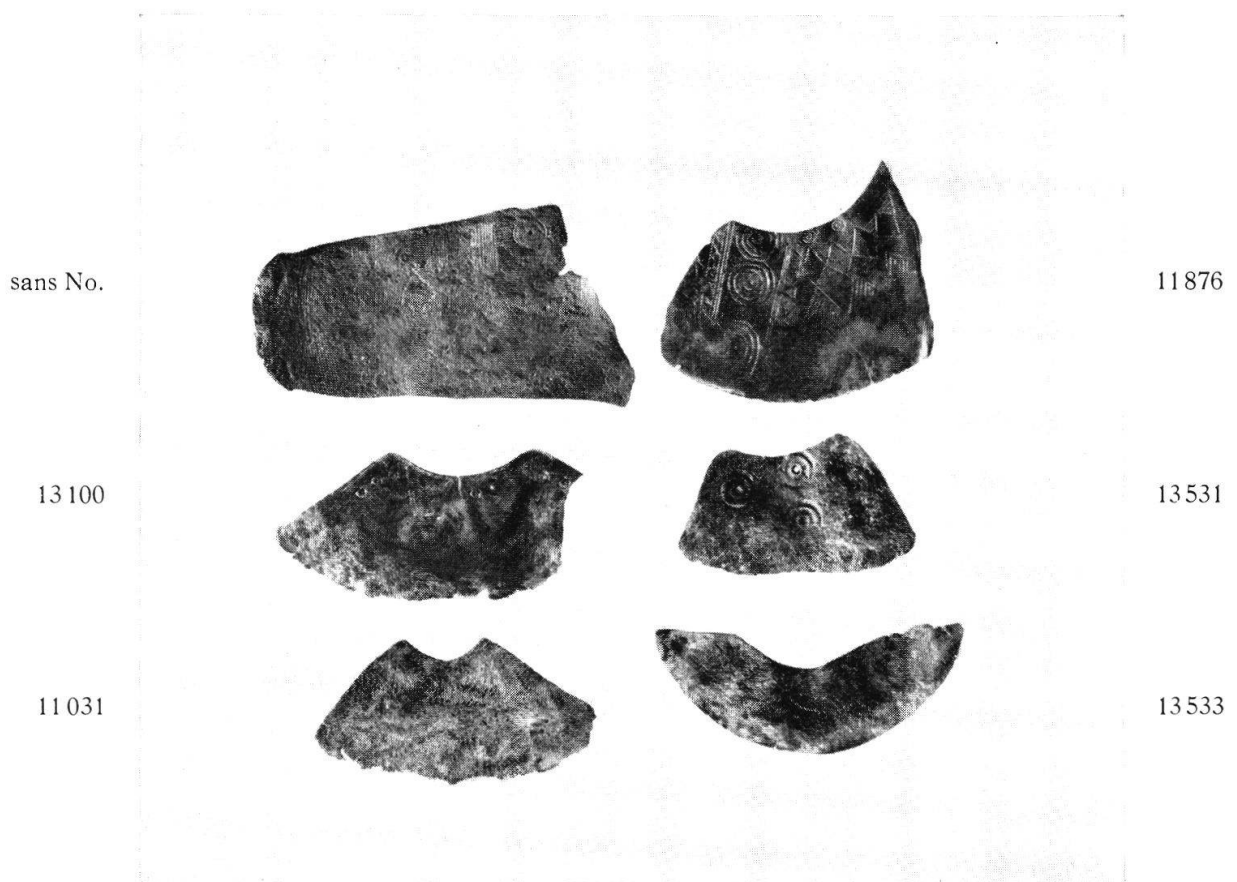
Planche XXV, Fig. 2. Corcelettes. Tranchets tirés de bracelets brisés (p. 141)