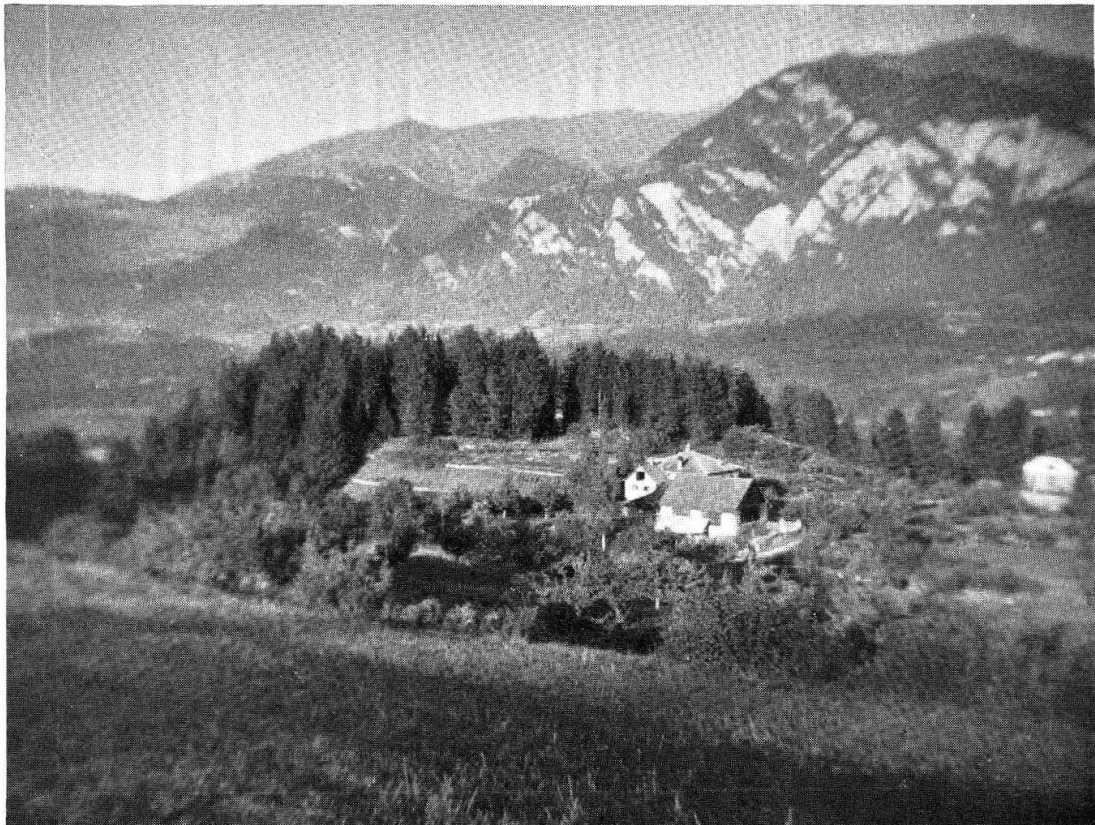
Tafel IV, Abb. 3. Cazis-Cresta, Ansicht von Südwesten (S. 43)