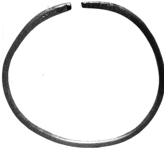
Tafel IV. Abb. 2. Armspange von Calfreisen (S. 94) nat. GröÙe.