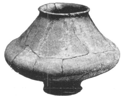
Tafel II, 3. Wohlen. Hohbühlwald. Lanzenspitze aus Eisen und Tonurne. S. 65. (Cliché der Heimatkunde-Vereinigung in Wohlen).