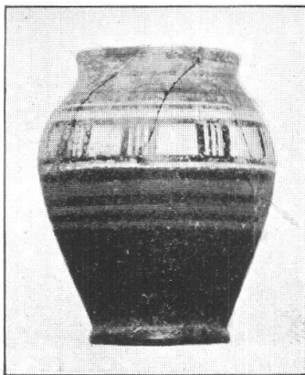
Tafel II, 2. Fully. Beudon. Tonbecher. S. 71. (Cliché LM. in Zürich).