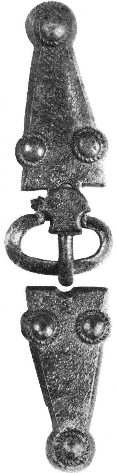
Abb. 37. Dreieckige Gürtelschnalle von Niederwangen. Nat. Gr.