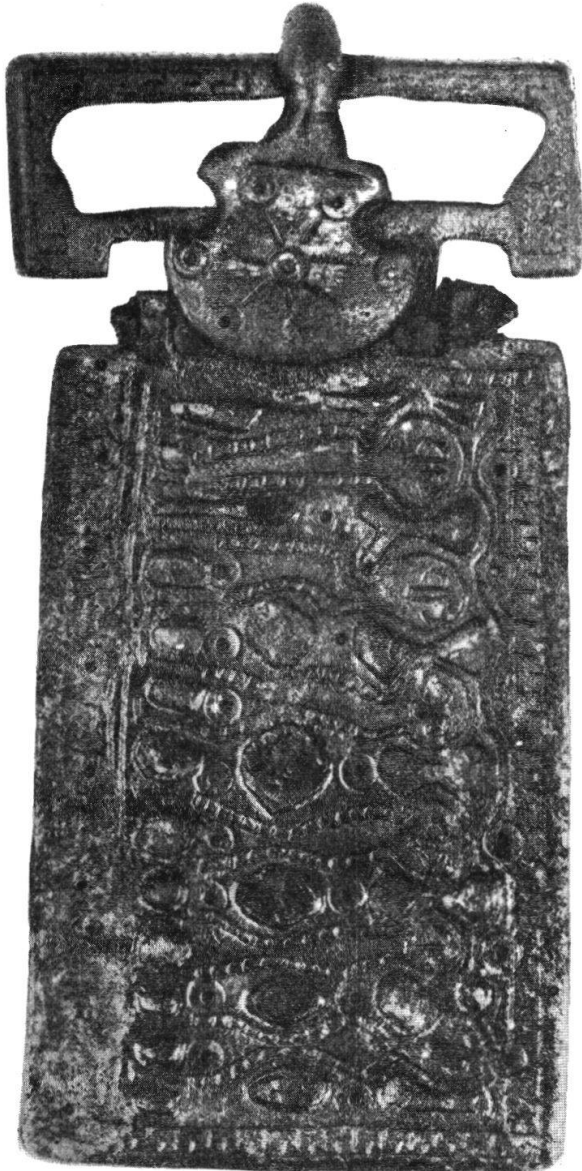
Abb. 36. Figurierte Gürtelplatte von Niederwangen. Nat. Gr.

Tschumi berichtet uns von einem im Moor bei Witzwil gefundenen Ango aus Eisen von 47,8 cm Länge, mit gespaltenem Tüllen-schaftende.