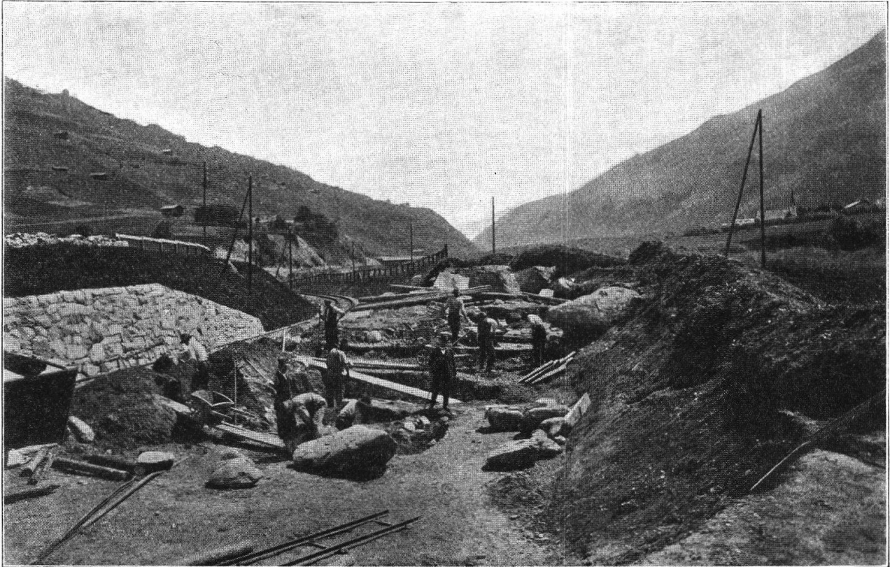
Abb. 23. Blick auf die Fundstelle des Gräberfeldes von Darvella.

folgende Funde gemacht: zwei einfache Bronzeringe und zwei do. mit Bernsteinkugelperlen (Typus Giubiasco, „Erste Eisenzeit, Periode IV“, Ulrich, Gräberfelder 2, Taf. 41, 13, 14), verschiedene Fibeln, von denen zwei von ausgezeichnetem Typus I b mit eingelegtem Email und mit Anklang an die tessinischen Formen (Typus Giubiasco, „zweite Eisenzeit, Periode I“, Ulrich, Gräberfelder 2, Taf. 44, 20, 21), Fragmente von zwei kleinen Bronzefibeln mit rotem und weissem Email, eine eiserne Fibel, zwei silberne Fingerringe und Fragmente von solchen. Die Sachen