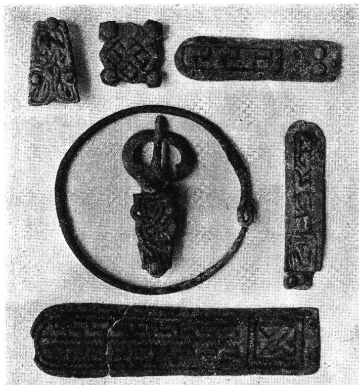
Fig. 72. Grabfunde von Trimbach.