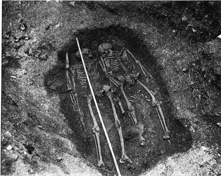
Fig. 71. Doppelgrab von Trimbach.

Laut freundlicher Mitteilung von Dr. Häfliger wurden auf der Lebern bei Olten, wo früher schon Alamannengräber entdeckt wurden, neue Funde gemacht. Ein Skramasax kam ins Museum nach Olten.