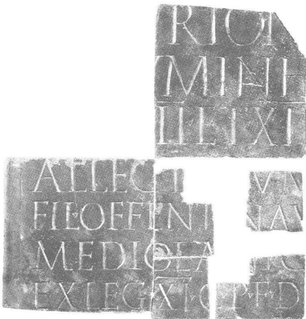
Abb. 2 Bronzetäfelchen von Wutöschingen (BRD); HM 333. Ohne M.

Beim Fund von Wutöschingen (Kr. Waldshut, BRD; Abb. 2) handelt es sich um ein nur fragmentarisch überliefertes Täfelchen, das ein aus Mediolanum stammender Soldat der legio XI Claudia anfertigen