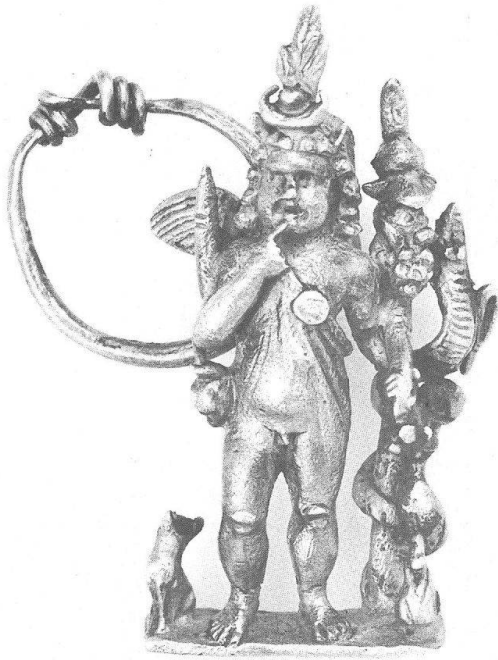
Abb. 3 Silberner Harpokrates aus der Mosel bei Trier. M. 2,5:1.

Bronzestatuette der Isis-Fortuna aus Prilly 14 . Sie erlauben Vermutungen über die religiöse Einstellung ihres einstigen Besitzers; bei Statuententypen wie dem der Isis-Fortuna muss im gallorömischen Gebiet allerdings immer auch mit der Möglichkeit gerechnet werden, dass ikonographische Motive – hier der Modius als Kopfschmuck und die Sonnenscheibe des Füllhorns – einfach von einer Vorlage übernommen wurden, ohne dass man deren religiöse Bedeutung erfasste. So scheinen die zahlreichen einheimischen Merkurstatuetten mit dem Lotusblatt des Hermes-Thot zwischen den Kopfblättern, von denen je ein Exemplar aus Avenches 15 und Kaiseraugst 16 bekannt ist, zum ursprünglichen Vorbild keine inhaltliche Beziehung mehr zu haben 17 .