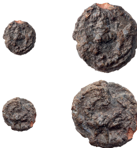
Abb. 6: Vorder- und Rückseite der Bleiplombe 5 (Inv. 1974.10235). Links: M. 1:1, rechts: M. 2:1.