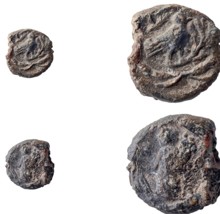
Abb. 5: Vorder- und Rückseite der Bleiplombe 4 (Inv. 1974.6815). Links: M. 1:1, rechts: M. 2:1.