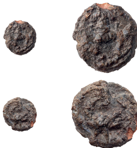
Abb. 6: Vorder- und Rückseite der Bleiplombe 5 (Inv. 1974.10235). Links: M. 1:1, rechts: M. 2:1.