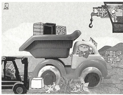
Spielzeugland für Willi Wiberg: Wo ist das richtige Paket?

mont in zwei unterschiedlichen Spielperspektiven zu durchleben und die Handlung entweder in der Rolle der schönen Belle oder des verwunschenen Schlossherrn und damit auf verschiedenen Wegen zu einem guten Ende zu führen.