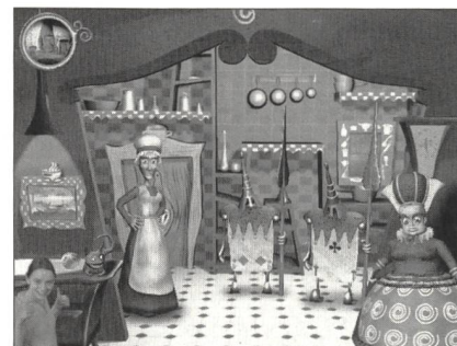
Alice im digitalen Wunderland: Kinderbuchklassiker als multimediales Spielabenteuer