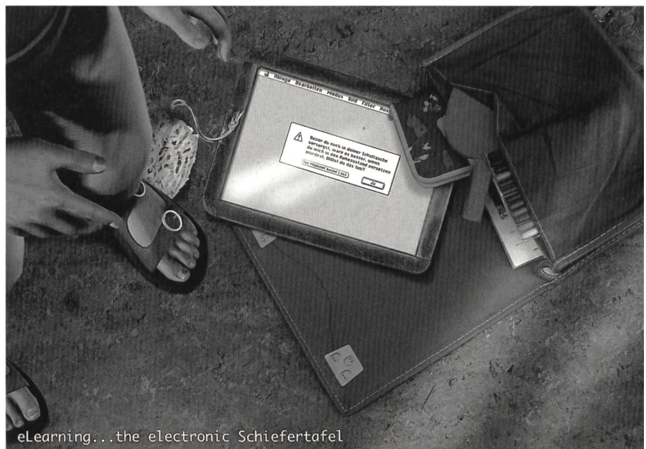
eLearning...the electronic Schiefertafel

Der vorliegende Artikel gliedert sich in drei Teile. Im ersten Teil wird der Swiss Virtual Campus kurz vorgestellt. Das Augenmerk gilt vornehmlich pädagogisch-didaktischen Themen. Der zweite Teil stellt die Arbeitsgruppe eQuality (educational Quality in eLearning) am Pädagogischen Institut der Universität Zürich vor. Im dritten Absatz werden allgemeine Überlegungen zum Lernen mit ICT (Informations- und Kommunikationstechnologie) dargelegt und die Notwendigkeit systematischer Evaluation virtueller Lernumgebungen begründet.