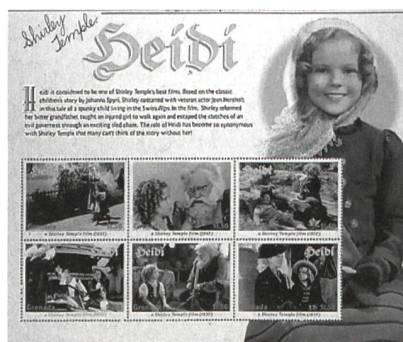
Shirley Temple als Heidi auf einer Briefmarke aus Grenada, 2000

ders fruchtbar, war doch das Buch damals weit verbreitet als Pflichtlesestoff an amerikanischen Schulen. Dadurch schnellte der Bekanntheitsgrad weiter in die Höhe, ebenso die Anzahl der erhältlichen Ausgaben. Im Zuge der allgemeinen Heidi-Begeisterung wagte das liebenswerte Alpenmädchen dann den Sprung auf die Bühne. Mit Erfolg. In den 1930er-Jahren waren Theateraufführungen von Heidi amerikaweit äusserst beliebt. Die Junior League sponserte eine ausgedehnte Theatertournee. Heidi wurde landauf, landab von Schulklassen, Vereinen und Laientheatern aufgeführt. Kein Wunder, hat daraufhin auch Hollywood Heidi für sich entdeckt. Die 1937er-Verfilmung von Twentieth Century Fox, mit dem singenden und tanzenden Kinderstar Shirley Temple in der Titelrolle, liess die Kinokassen klingeln. Der Film ragt als Markstein aus Heidis amerikanischer Erfolgsgeschichte. Shirley Temple, goldgelockt und pausbäckig, verkörpert bis heute das «typisch amerikanische» Heidi.