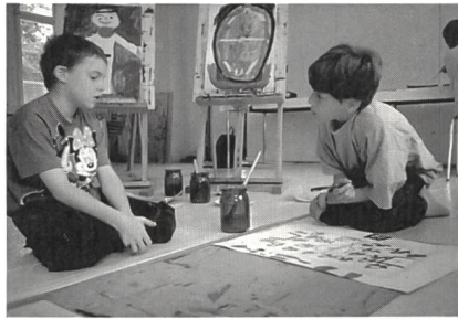
Bilder aus dem Workshop ...

Im Juni gehörte das eigens eingerichtete Atelier mit zur Ausstellung. Gegen 40 Klassen (1.–3. Schuljahr) hatten sich angemeldet, 25 konnten wir berücksichtigen, bevor sich unser idyllisches Atelier wieder in einen nüchternen Kursraum verwandelte. Rund 600 Porträts sind so entstanden: farbig und vielfältig. Sie bleiben im Archiv. Ein bisschen schwierig war es für die Kinder schon, «ihre» Zeichnungen und Bilder der Ausstellung zu überlassen. Für ein Kind ist es nicht unbedingt tröstlich, dass ihre Bilder im Archiv für Interessierte zugänglich bleiben und vielleicht auch einmal in einer Ausstellung gezeigt werden.