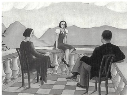
Ohne Angaben, Gymnasium Lugano, Schweiz, um 1940

Das ehemalige «Internationale Institut zum Studium der Jugendzeichnung» wurde 1932 gegründet und viele Jahre durch den Zeichenlehrer Jakob Weid-