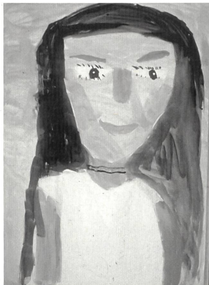
...«Ich bin Lisa ...