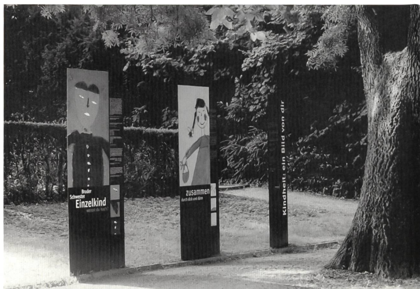
Die Galerie im Park.

«Beten und glauben», «zusammen durch dick und dünn», «wünschen und träumen» – die ausgewählten Themen sollten nun anhand von verschiedenen Quellen und Medien dargestellt werden. Mit literarischen Texten, demografi-