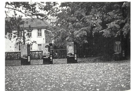
Kultur und Natur am Beckenhof.

1850: 5.02 Personen 1910: 4.49 Personen 1950: 3.41 Personen 1990: 2.24 Personen Oder die Veränderung des Jugendquotienten im Kanton Zürich (prozentualer