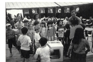
von oben nach unten: Kinder malen Selbstporträts Ausstellung «Kindheit: ein Bild von dir» Schulklassen an der Preisverteilung des Homepage-Wettbewerbs