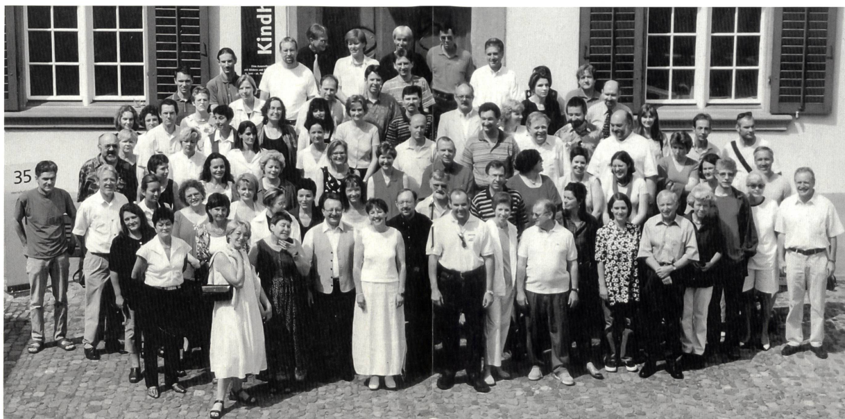
1. Juli 2000: Mitarbeiter/innen des Pestalozzianums bereit zum Einsatz am Open House®.