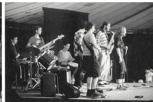
von links nach rechts: Interaktives Theater mit der Theatergruppe Playback ... ... aktive Schüler/innen der Jugendband Pourquoi pas?

Vom 6. Juni bis zum 1. Juli 2000 war am Beckenhof alles ein bisschen anders: Das Wetter zeigte sich vier Wochen lang von der besten Seite; ideale Voraussetzung für die Pestalozzianer/innen, ihre Jubiläumsnummern im Zelt und im Park aufzuführen. Das Spektrum der Veranstaltungen reichte von bildender Kunst bis zur Kunst der Bildung. Ob Schüler/innen, Lehrer/innen, Schulbehörden oder Bildungsdirektoren, alle im Bildungswesen Mitwirkenden waren zu speziellen Veranstaltungen eingeladen, und viele machten von diesen Angeboten Gebrauch.