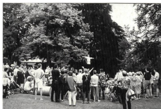
Jubilieren, balancieren, jonglieren: Zirkusworkshop für Kinder im Park.