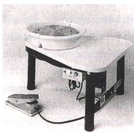
Töpferschleife MICHEL E400 Die elegante Töpferschleife Fr. 1790.– inkl. Mwst