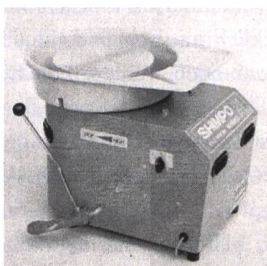
Töpferschleife SHIMPO LP Die kompakte Töpferschleife Fr. 1485.– inkl. Mwst