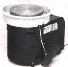
Töpferschleife SSB 2 Töpferschleife mit Ringkonus Fr. 1190.– inkl. Mwst