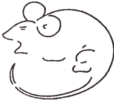
Was zeigt die Figur? Entweder ... oder

Für Kinder und Jugendliche ist es wichtig, dass Orientierungssignale für ihr Ver-