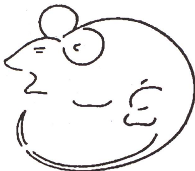
Was zeigt die Figur? Entweder ... oder

Für Kinder und Jugendliche ist es wichtig, dass Orientierungssignale für ihr Ver-