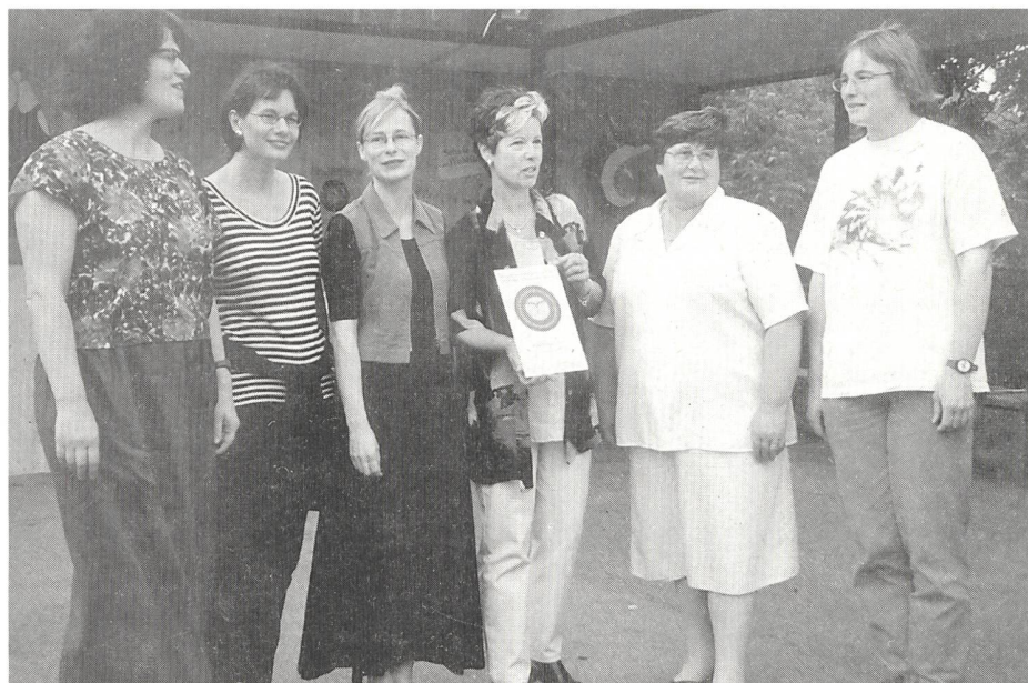
Erste Auszeichnung einer Schule im Kanton Zürich mit dem Label «Gesundheitsfördernde Schule»: Schulhaus Birchlen, Dübendorf.