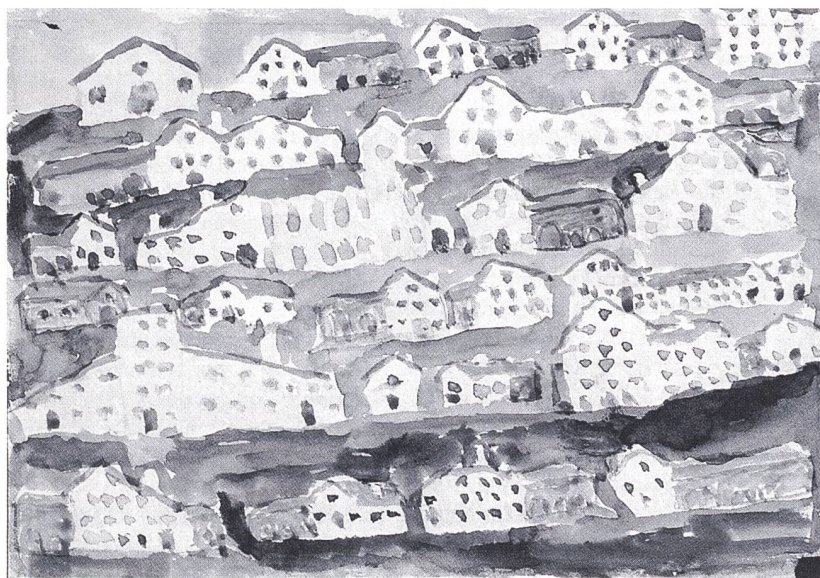
Industriestadt. Max Dürstel, 8 Jahre, Fahrwangen ab 1956. Pestalozzikalender-Wettbewerb

Das Werkzeug zur Erschliessung dieser unterschiedlichen Bestände – Segen unserer Zeit – ist die elektronische Datenverwaltung. Sie ermöglicht die Quersuche, ohne dass bestehende Ordnungen angetastet werden müssen. Die Arbeiten sind in Gruppen zusammengefasst. Eine Gruppe beansprucht eine oder meh-