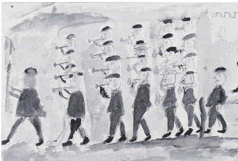
Die Musik kommt. 10 Jahre. Alto Adige, Italien, nach 1930. Internationales Institut für das Studium der Jugendzeichnung

rere Schubladen. Jede Gruppe ist inhaltlich und quantitativ beschrieben in einem Datensatz beziehungsweise einer Karteikarte. Es existieren Gruppen