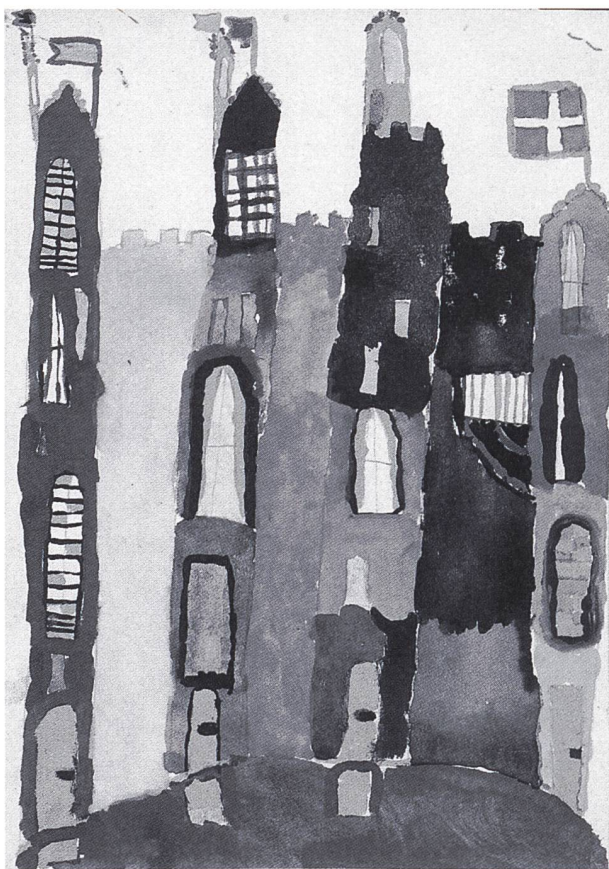
Zauberschloss. Remi Erzinger, 9 Jahre, Riet Gibswil ZH 1963. Pestalozzikalender-Wettbewerb