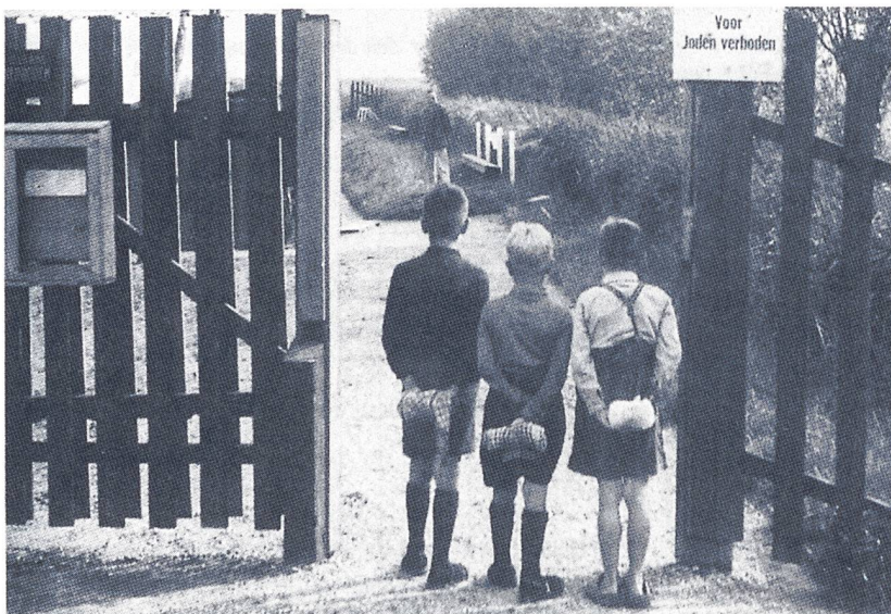
Für Juden Verboten: Eine Tafel am Eingang eines holländischen Schwimmbades während der deutschen Besatzung untersagt Juden die Benutzung.