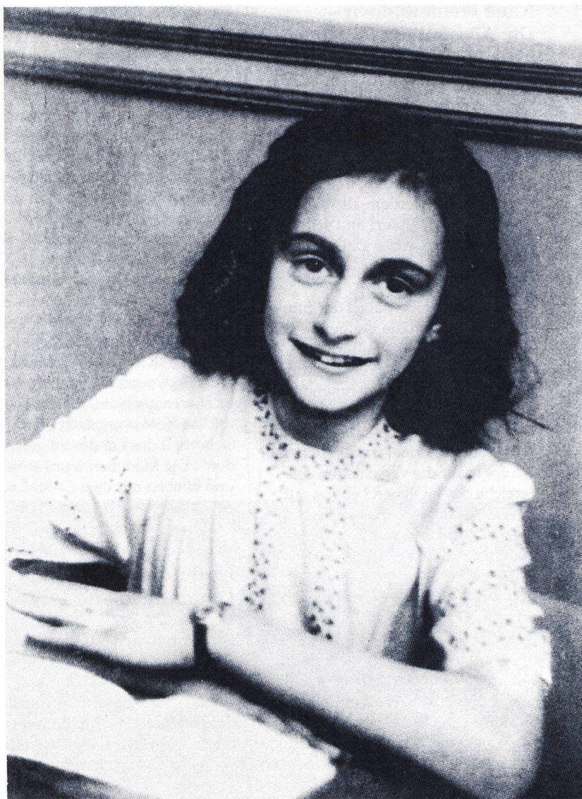
Fotografieren für Juden verboten! Aus der Zeit des Untertauchens gibt es keine Fotos von Anne Frank.

Anne Frank war eine ganz gewöhnliche Jugendliche – und doch auch ungemein mutig auf dem Weg zu sich selbst. Sie war eingesperrt auf einem Lebensraum von einigen Quadratmetern mit einem begrenzten Ausblick: einem Dachfenster mit einem Stück Himmel, einem Stück Kastanienbaum und manchmal einer vorbeiziehenden Wolke, einer Möwe. Zur Verfügung standen ihr