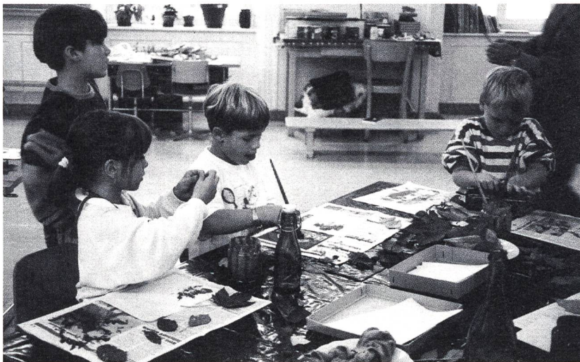
Im Schulzimmer werden mit den gesammelten Blättern und Früchten farbige Abdrücke gestempelt

Ein Grossteil der Zürcher Bevölkerung lebt heute in städtischen Verhältnissen. Die Umwelt vieler Kinder zeichnet sich – nicht nur in den Zentren Zürich und Winterthur, sondern auch in den Agglomerationsgemeinden – durch wachsende Naturferne aus. Die meisten naturkundlich orientierten Unterrichtsprogramme und Lehrmittel beziehen sich jedoch immer noch vorwiegend auf die "intakte Natur" in stadtfernen, ländlichen Lebensräumen und ihre (schützenswerte) Tier- und Pflanzenwelt.