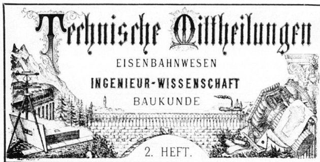
Abb. 4 TM. Kopf des Titelblattes, 1876 bis um 1910.

Schweiz im Bild 1974 = Schweiz im Bild – Bild der Schweiz? Landschaften von 1800 bis heute . Katalog der Ausstellung in Aarau, Lausanne, Lugano und Zürich, 1974, bearbeitet im Kunstgeschichtlichen Seminar der Universität Zürich, Zürich 1974.