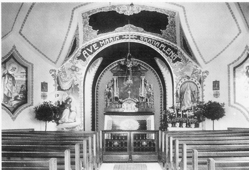
Abb. 99: Mettenwegkapelle (bei Buochserstrasse 45). Innenaufnahme, wohl kurz nach Fertigstellung 1913.

Felix 1865, Freischiessen = Heinrich Felix, Festbüchlein auf das eidgenössische Freischiessen in Stans pro 1861 , Luzern 1861.