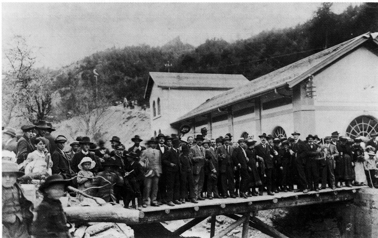
Fig. 8 Inauguration de l'usine électrique de Lienne II le 5 mai 1918.

1914–1917 Construction de l'usine électrique de Lienne II qui renforce celle du Beulet. Inauguration le 5 mai 1918.