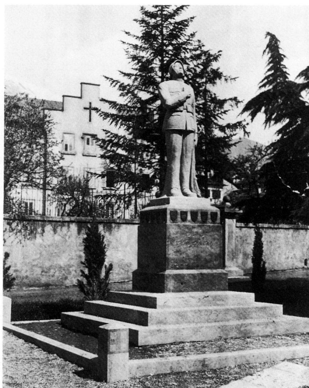
Fig. 10 Monument dédié aux soldats morts pour la patrie sculpté par Jean Casanova et installé en 1923 devant le séminaire épiscopal sur la place de la Cathédrale.

1931–1934 Construction de la rue de Gravelone .