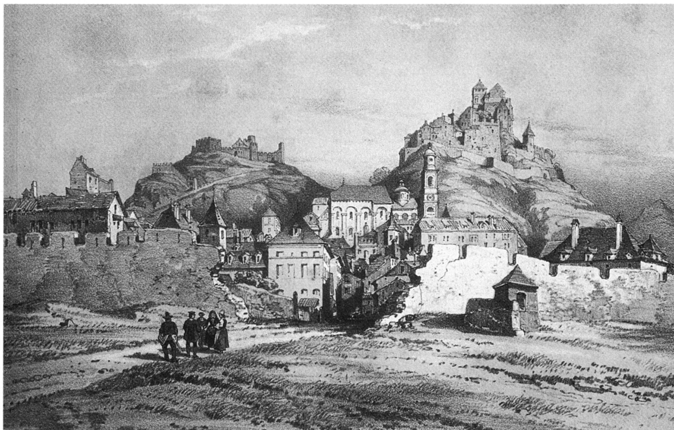
Fig. 2 Les fortifications occidentales de la ville de Sion peu après le démantèlement de la porte de Conthey. Lithographie de Théodore Du Moncel, 1838.

1843 Projets pour un Hôtel national (Palais du Gouvernement) par l'architecte veveysan Philippe Franel et l'ancien père jésuite Etienne Elaerts. Voir 1848.