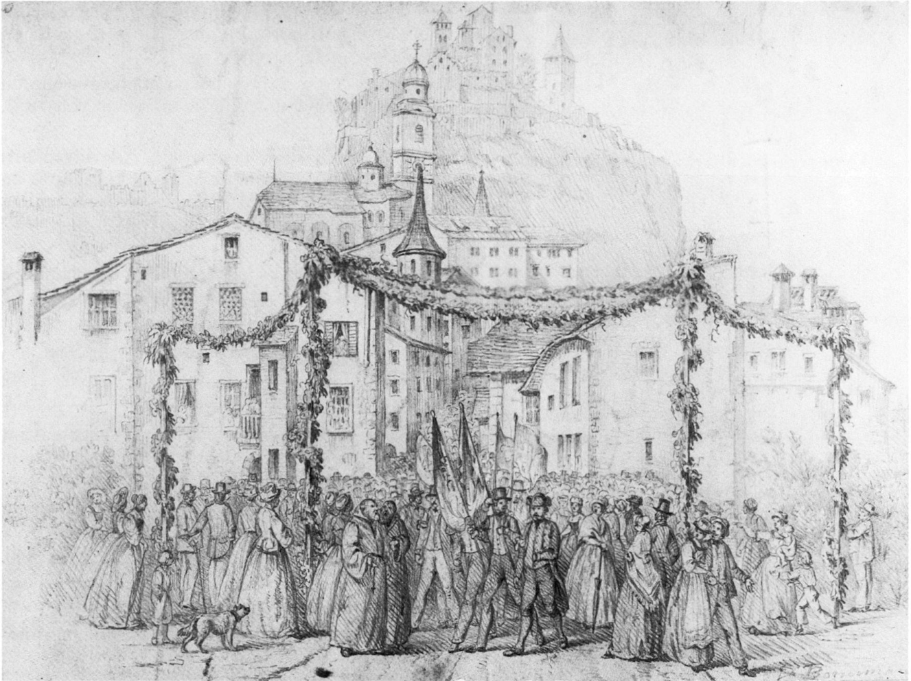
Fig. 3 Rassemblement pour les concerts organisés à l'occasion de l'assemblée de la Société helvétique de musique en juillet 1854. Xylographie publiée dans la Suisse illustrée , 1854.

1859 Construction de la maison Solioz à la rue de Lausanne No 21.