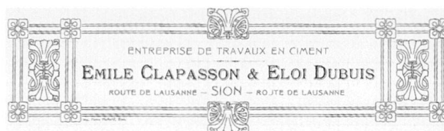
Fig. 16 En-tête de lettre de l'entreprise Clapasson et Dubuis en 1919.