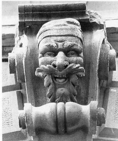
Abb. 107 Wohn- und Geschäftshaus Alpenblick . Dekorativer Schlussstein des 1899 abgebrochenen Landtwingschen Fideikommissses.

vaten Bauten, vereinzelte Bebau- ungs- und Stadtpläne.