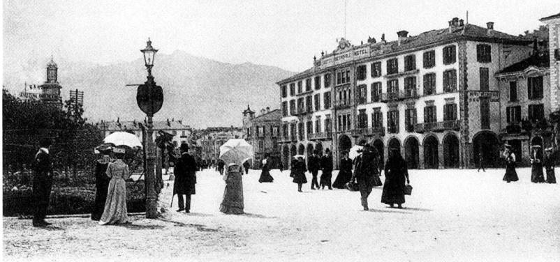
10039 Phototypie Co., Neuchâtel.