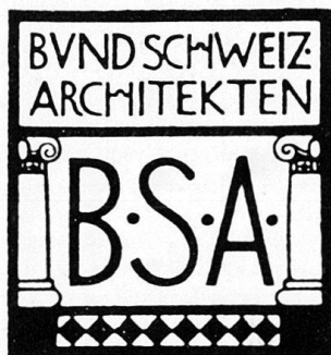
Abb. 1 Signet der 1908 gegründeten Architekten-Vereinigung BSA vom Titelblatt des Vereinsorgans Die schweizerische Baukunst , Jahrgang 1, 1909.