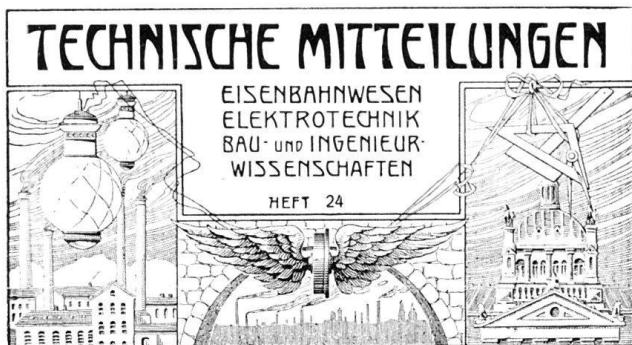
Abb. 5 TM. Kopf des Titelblattes, verwendet um 1910 bis 1920.

Schwabe 1976 = Hansrudolf Schwabe, Schweizer Strassenbahnen damals . Erinnerungsbilder an den Trambetrieb in der Schweiz vor dreissig, fünfzig und hundert Jahren, Basel 1976.