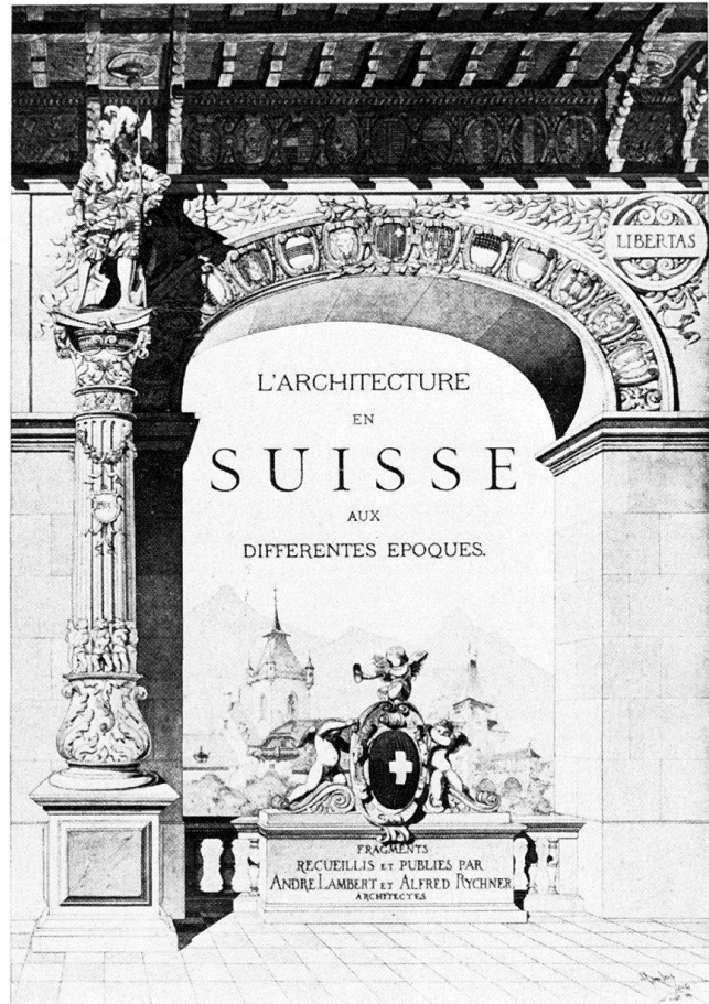
Fig. 3 Lambert-Rychner 1883. Frontispice, dessin de l'architecte André Lambert (1851–1929), 1883.