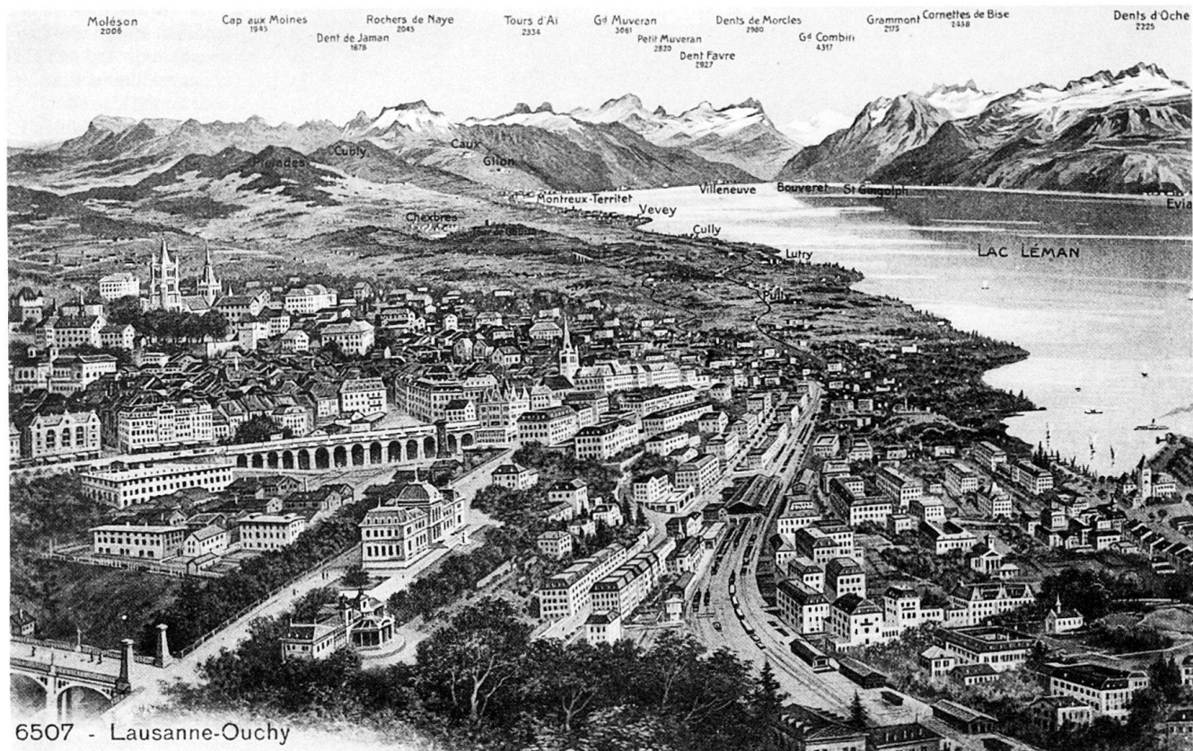
Fig. 282 Lausanne-Ouchy . Vue de l'ouest sur la ville, le lac et les Alpes, vers 1910. Carte postale.