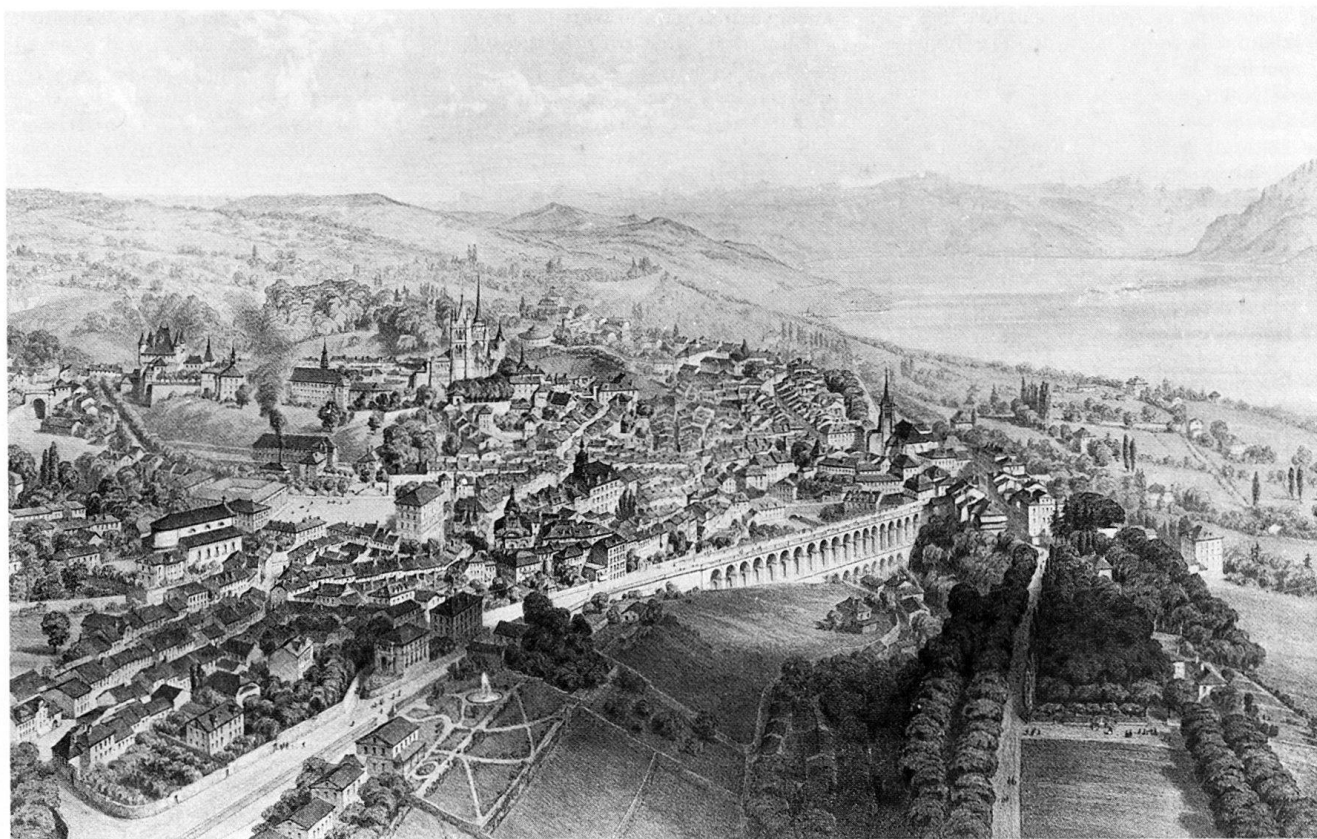
Fig. 281 Lausanne à vol d'oiseau, vue de l'ouest. Lithographie d'Alfred Guesdon, vers 1860.

noud, syndic, Georges Rouge, architecte, et Jules Gonin, ingénieur cantonal.