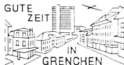
Abb. 178 Ortswerbeflagge (Bildstempel) für das Postamt 1 in Grenchen, verliehen am 22.10.1979. Darstellung der gleichen Örtlichkeit wie in Abb. 177. Historischer Gasthof Löwen (1838) sowie Hochhaus am Marktplatz und Flugzeug. Vgl. Abb. 177.