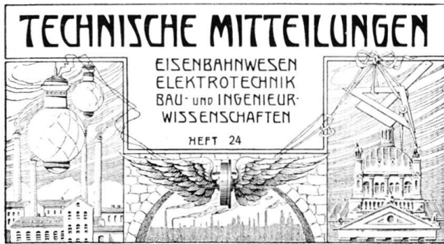
Abb. 3 TM. Kopf des Titelblattes, verwendet um 1910 bis 1920.

UKD = Unsere Kunstdenkmäler . Mitteilungsblatt für die Mitglieder der GSK, Bern 1950ff. / Nos monuments d'art et d'histoire (NMAH) . Bulletin destiné aux membres de la SHAS, Berne 1950ss. / I nostri monumenti storici (NMS) . Bollettino per i membri della SSAS, Berna 1950ss.