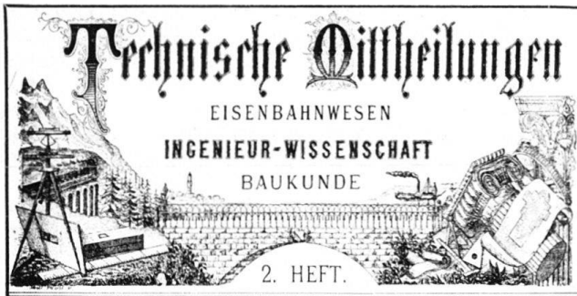
Abb. 2 TM. Kopf des Titelblattes, verwendet von 1876 bis um 1910.