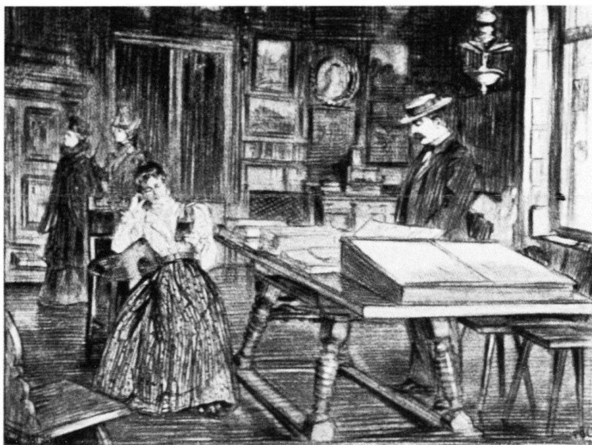
Abb. 410 Baden. Antiquitätenkabinett im Kursaal. Bis zur Überführung der antiquarischen Sammlung ins ehemalige Landvogteischloss (1913) konnten die lokalen Altertümer, darunter auch römische Funde, hier bewundert werden. Zeichnung von Hans Meyer-Cassel, in der Zeitschrift Die Schweiz 4 (1900), S. 87.

SB 3 (1911), S. 303: Abb. 341, 343; S. 306: Abb. 340, 342; 5 (1913), S. 9: Abb. 156; S. 13: Abb. 157.