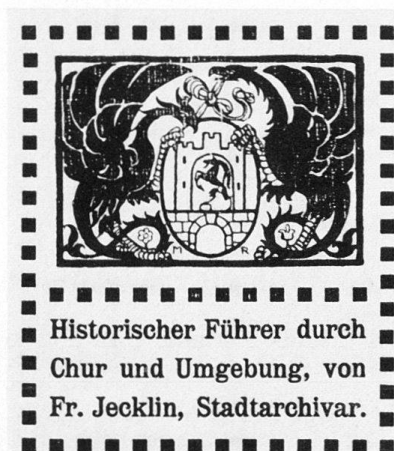
Abb. 394 Chur. Titelvignette, gezeichnet von Architekt Martin Risch 1909, in Abwandlung der Schnitzerei von 1525 über dem Rathausportal, welche das von Basiliken gehaltene Stadtwappen darstellt. Vgl. Abb. 12

Chur 1900 = Chur. Kleiner Reiseführer mit Karte der Umgebung [samt Exkursionsrouten], o. J. (um 1900).