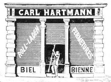
Abb. 482 Inserat der Rolladen-Firma Hartmann aus der Zeitschrift Heimatschutz 1 (1906), Heft 6.