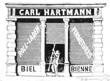
Abb. 482 Inserat der Rolladen-Firma Hartmann aus der Zeitschrift Heimatschutz 1 (1906), Heft 6.