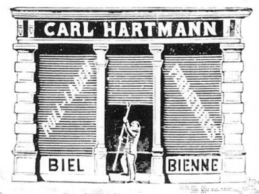
Abb. 482 Inserat der Rolladen-Firma Hartmann aus der Zeitschrift Heimatschutz 1 (1906), Heft 6.