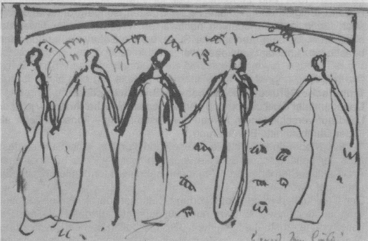
Ferdinand Hodler, Kompositionsstudie "Blick in die Unendlichkeit" 1914/15

Resultaten einiger empirischen Studien zuwenden, mit anderen Worten vom philosophischen auf den sozialwissenschaftlichen Blickwinkel wechseln.