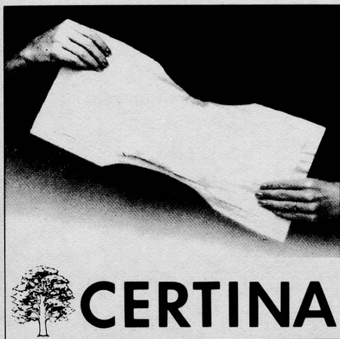
Inkontinenz-Vorlagen «normal» und «extra»