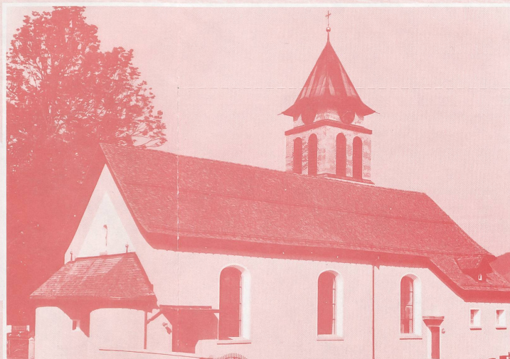
St. Jean Nepomuk à Gross SZ

»Nous apprenons avec joie que votre assemblée a décidé de nous octroyer un subside annuel de Fr. 10'000.—. Nous vous remercions de tout coeur.» Paroisse du Tessin