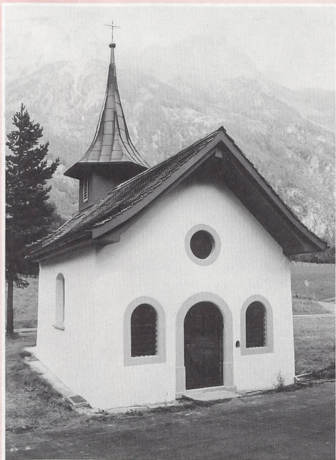
Ste-Ursule à Silenen UR