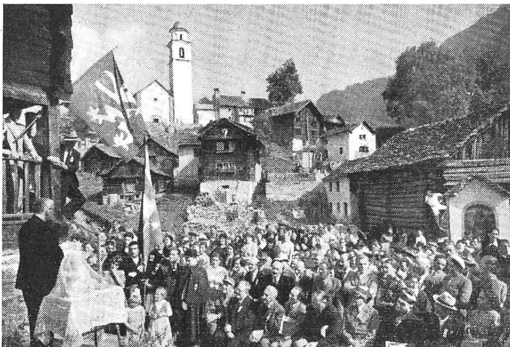
700-Jahrfeier in Bosco-Gurin