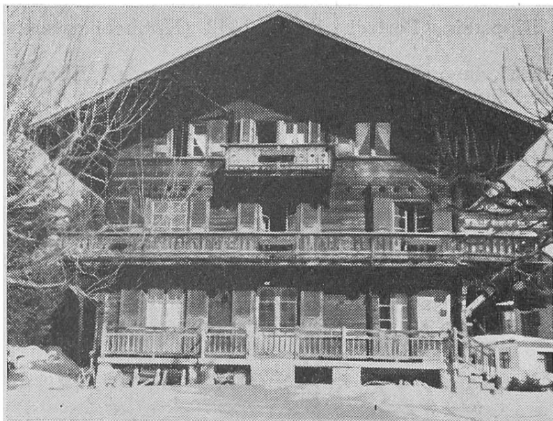
Villars sur Ollon Chalet St-Pierre mit Werktagskapelle