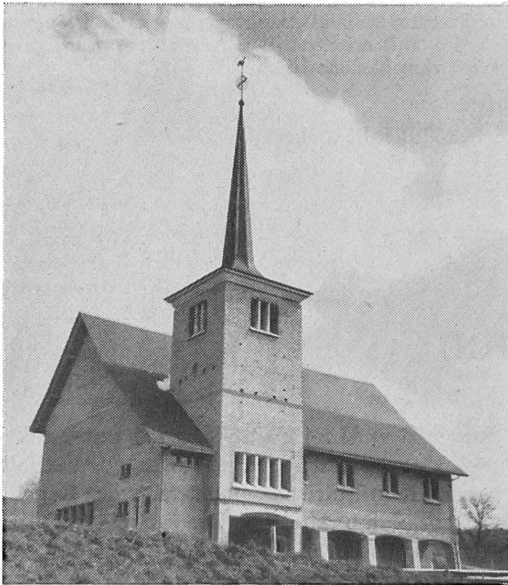
Neue Kirche für die Katholiken in Courtepin-Courtaman

Das katholische Leben in der Freiburger Diaspora wurde bereichert durch zwei Ereignisse, welche wir hier erwähnen wollen. Am 2. Sept. 1951 war die Segnung der 500 Kirchenbesucher fassenden Rosenkranzkirche in Courtepin . Zu ihr gehören alle Katholiken des Umkreises von Courtepin-Courtaman. In selbstlosester Weise hat der Pfarrer in Barberêche dieses Werk gefördert. – In Murten bereitet seit 1951 ein katholischer Kindergarten die Kinder für den Unterricht in den katholischen Primarschulen vor.